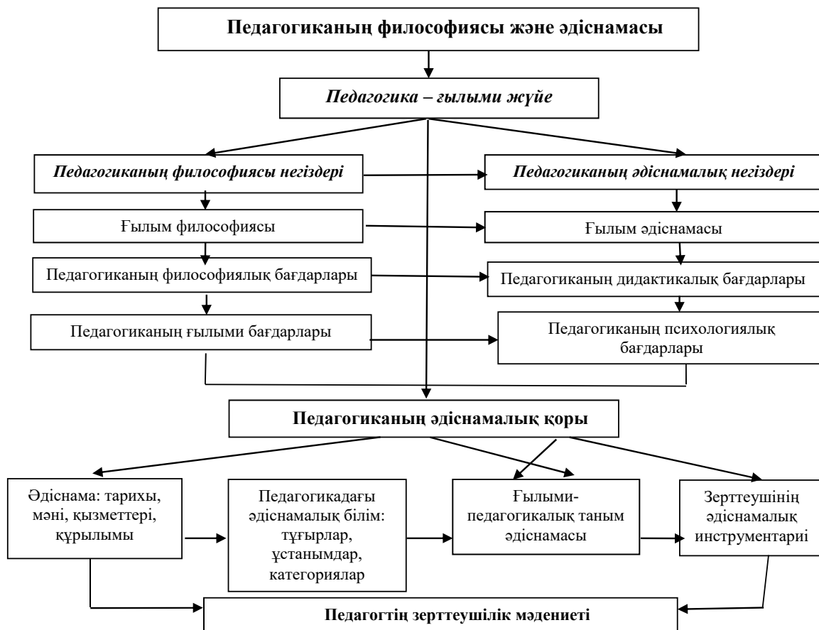
2-сурет – «Педагогиканың философиясы мен әдіснамасы» пәнінің логикалық құрылымы

1-кесте – «Педагогика философиясы және әдістемесі» пәні бойынша оқытудың күтілетін нәтижелері және білім алушылардың жетістіктерінің көрсеткіштері