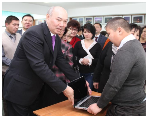
Сурет. ҚР Білім және ғылым министрі Б.Т.Жұмағұловтың қатысуымен мүмкіндігі шектеулі балаларға ұйымдастыру техникасын тарату сәттері

Жергілікті «Қызылорда қоғамдық теледидары» телеарнасы арқылы мүмкіндігі шектеулі балаларды «Қашықтықтан оқыту» бағдарламасы бойынша атқарылған жұмыстарды насихаттау мақсатында «Үйден оқыту» айдары ашылып, онда үйден оқытылатын оқушылармен он-лайн режимінде өткізілген интерактивті сабақтар көрсетілуде.