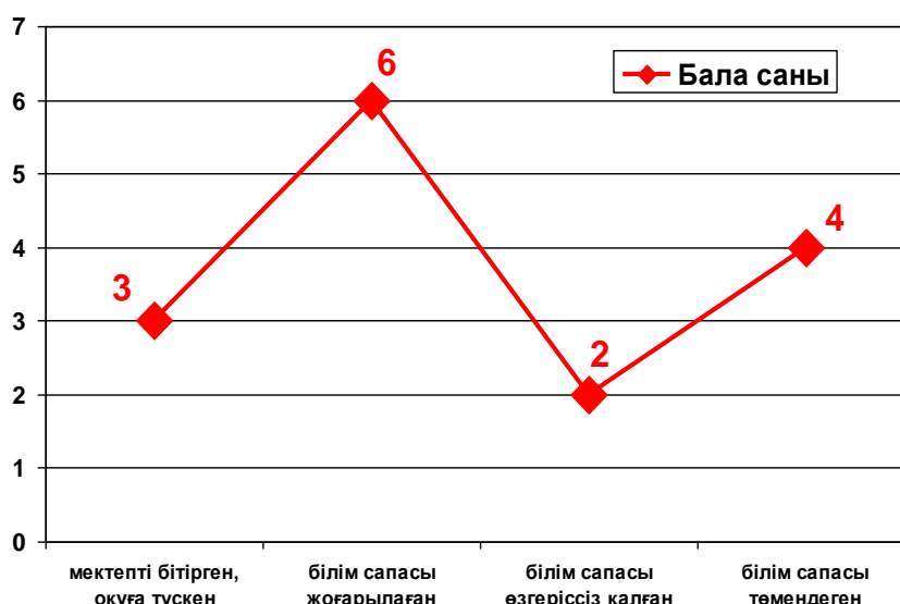
Сурет 2. Сырдария ауданы бойынша компьютер алған үйден оқытылатын мүмкіндігі шектеулі оқушылардың білім сапасы

Жалпы алғанда, Қызылорда облысы бойынша аталған бағытта атқарылған жұмыстар өз нәтижелерін көрсетуде. Қызылорда қаласы бойынша аталған 33 оқушының 11 (33 пайыз) оқушысында, Сырдария ауданы бойынша 15 оқушының 9 (60 пайыз) оқушысында елеулі оң өзгерістер байқалады.