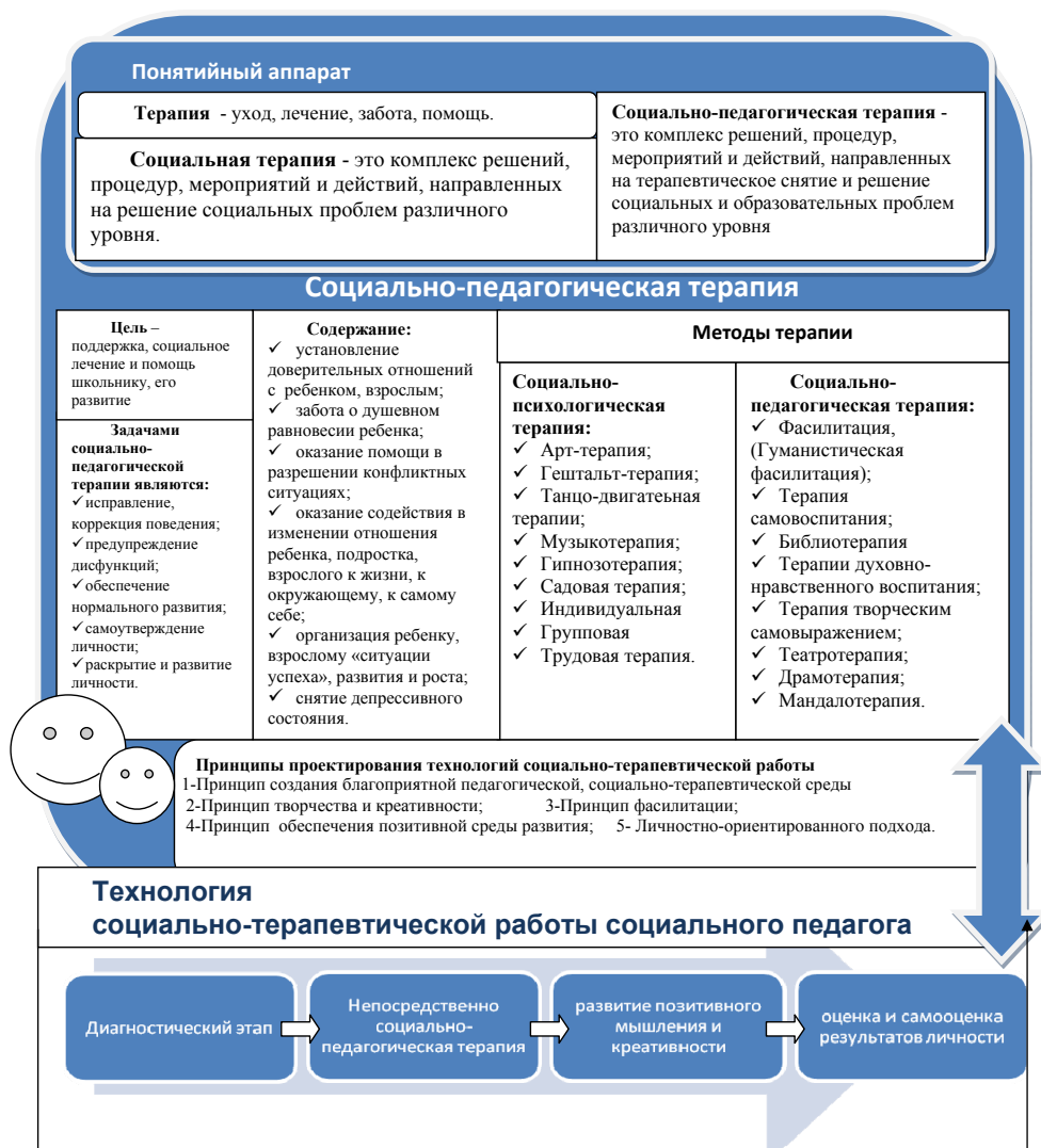
Рисунок 2 – Модель проектирования технологии социально-терапевтической работы социального педагога

Представим модель проектирования социально-терапевтической деятельности социального педагога на рисунке 2. Модель включает отражение теории социально-педагогической терапии в область технологий через принципы проектирования технологии социально-терапевтической работы.