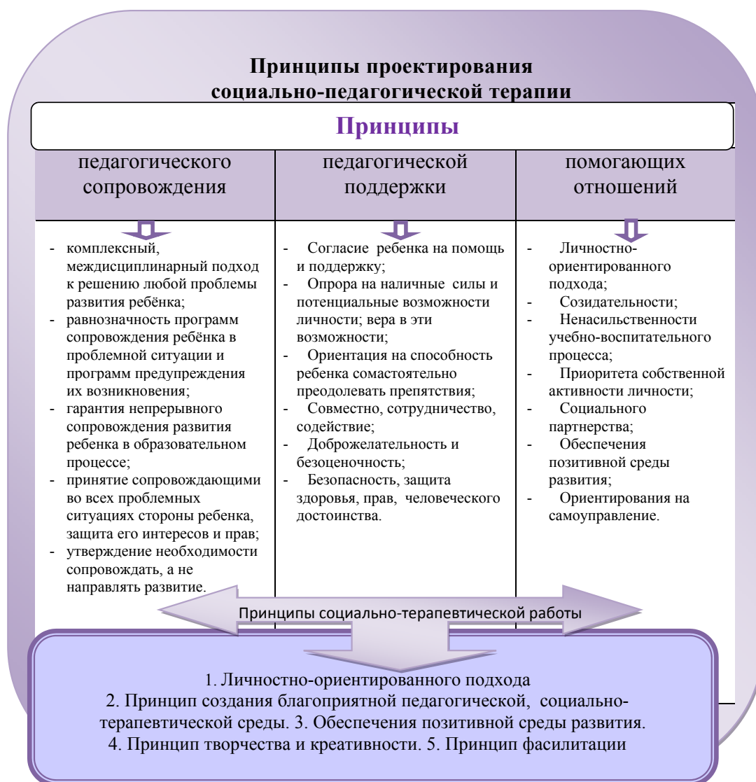
Рисунок 1 – Принципы проектирования социально-педагогической терапии

Принцип личностно-ориентированного подхода. Согласно ему важно формирование личности, развитие его качеств, раскрытие личности, его самореализация. Осуществляется через учет индивидуальных особенностей, репрезентативных систем учащегося; единства познавательной, интеллектуальной деятельности с коллективной деятельностью и чувственным переживанием. Использование многообразия методик работы педагога, рефлексивных технологий развития личности, развития «Я-концепции» личности. Здесь важны гуманистическое наполнение – уважение к личности ребенка, его взглядам, его позиции и др. Принцип воплощается и