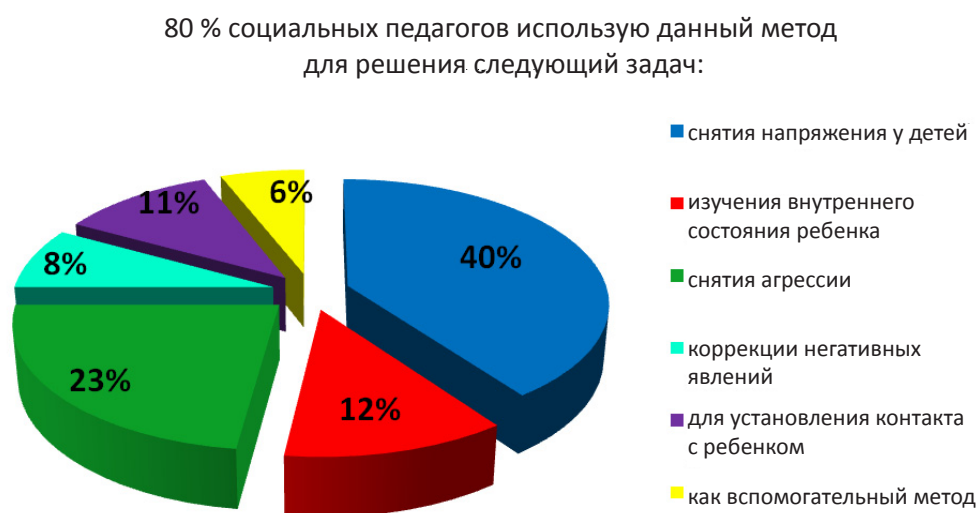
Рисунок 5 – Применение метода арт-терапии

Метод арт-терапии практикуют 80% опрошенных социальных педагогов для решения следующих задач: снятия напряжения у детей (40%); изучения внутреннего состояния ребенка (12%); снятия агрессии (23%); коррекции негативных явлений (8%); для установления контакта с ребенком (11%); как вспомогательный метод (6%) (рисунке).