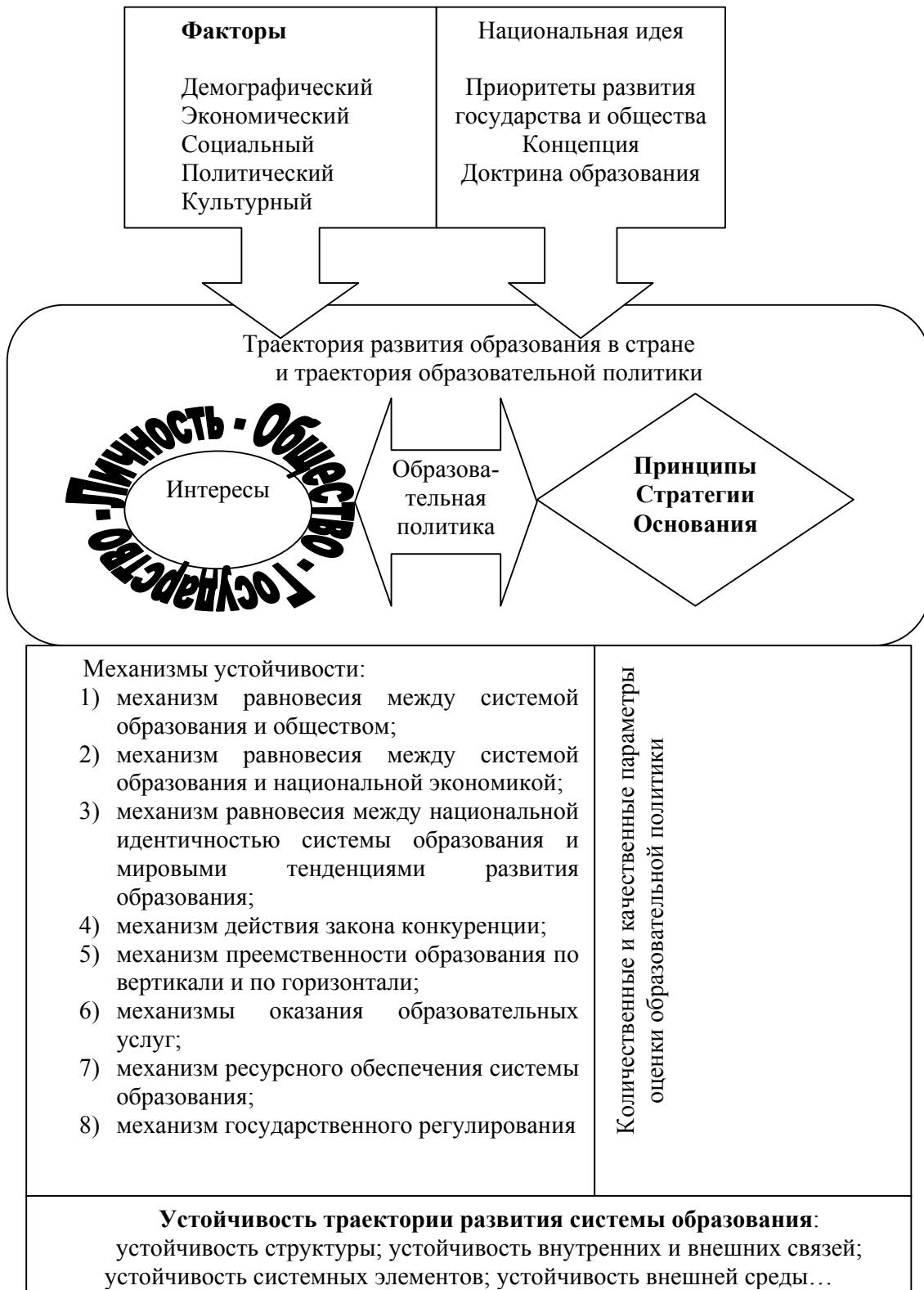
Рисунок 2 – Модель образовательной политики страны, ориентированная на устойчивость траектории развития системы образования