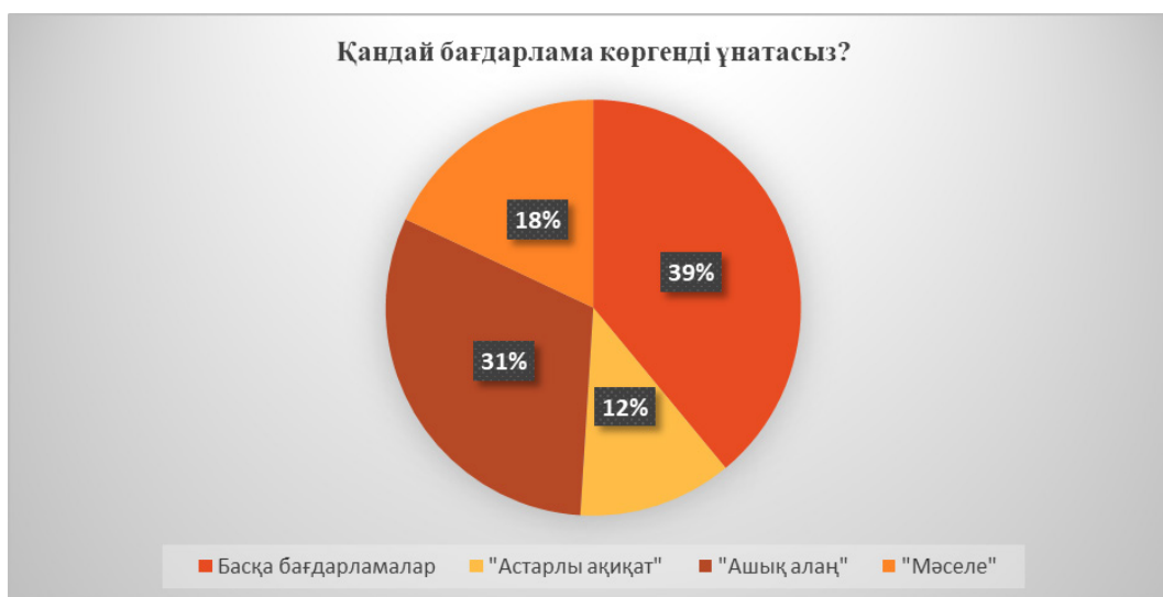
3-сурет – Теле бағдарламалар бойынша көрсеткіш. «Қандай бағдарлама көргенді ұнатасыз?» сұрағының жауаптары.

Төмендегі диаграммада «Қай бағдарлама жастар тәрбиесіне кері әсер етеді деп ойлайсыз?» деген сұраққа 73% «Қалаулым» бағдарламасы деп бір ауыздан көрсеткен. Біздің университеттің жастары да аталған бағдарламаның жастар тәрбиесіне кері ықпалын көрсетіп отыр.