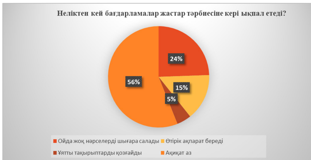
5-сурет – Бағдарламалардың тәрбиелік мүмкіндіктері. «Неліктен кей бағдарламалар жастар тәрбиесіне кері ықпал етеді?» сұрағының жауаптары

ріміздің өз ақиқаты бар, яғни олардың пікірінше 24% «ойда жоқ нәрселерді шығара салады» десе, 15% «өтірік ақпарат береді», 56% «Ақиқат аз», 5% «Ұятты тақырыптарды қозғайды» деген жауаптар алынды.