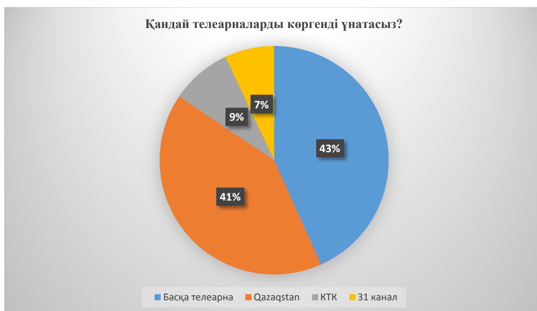
2-сурет – Студенттердің телеарналарды қарау көрсеткіштері. «Қандай телеарналарды көргенді ұнатасыз?» сұрағының жауаптары