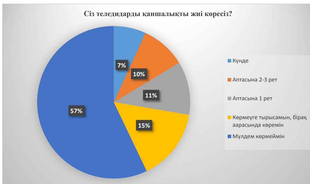
1-сурет – Студенттердің теледидарды көрудегі үлесі. «Сіз теледидарды қаншалықты жиі көресіз?» сұрағының жауаптары

берген. Яғни, көптеген студенттер ағылшын тілін үйрену үшін шетелдік телеарналардың бағдарламаларын қарайды, бірақ та біздің Қазақстан ұлттық телеарнасының да аудиториясы кеңейіп келе жатқанын көреміз, ал респонденттердің біразы КТК мен 31 канал қоғамдағы шынайы фактілерді нақты айтады деген пікірде.