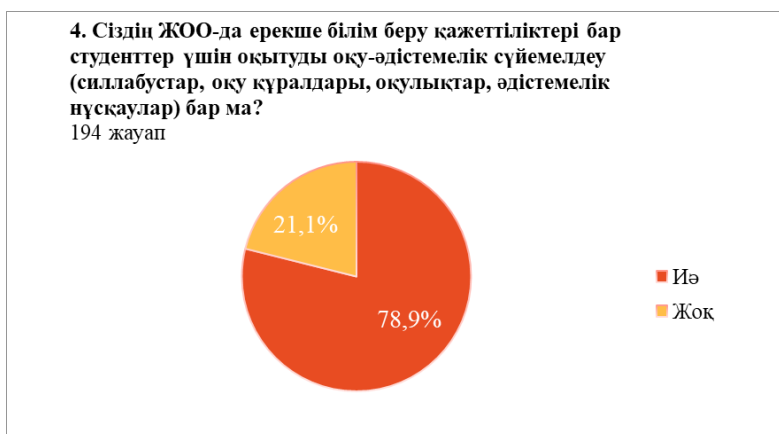
4-сурет – Сауалнаманың төртінші сұрағының нәтижелері

Келесі сұрақ алдыңғы сұрақпен байланысты және ол силлабустарда ерекше білім беру қажеттіліктері бар студенттерге арналған әдістемелік нұсқаулар бар екенін көрсетеді, «бар» деп сауалнамаға қатысқандардың 71,6% жауап берсе, қалғандары олардың жоқтығын көрсетті.