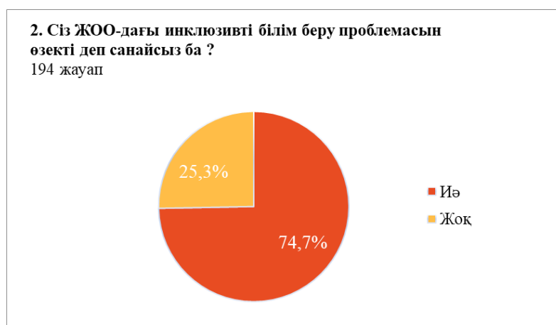
2-сурет – Сауалнаманың екінші сұрағының нәтижелері

ЖОО-да мүгедек студенттерді оқыту үшін жасалған жағдайлар туралы мәселе оқу орындарында қолжетімділікті ұйымдастырудың