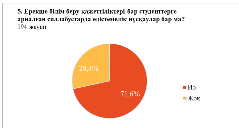
5-сурет – Сауалнаманың бесінші сұрағының нәтижелері