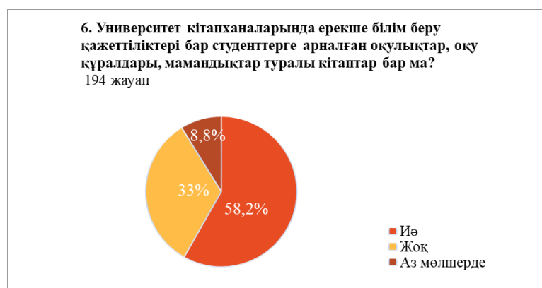
6-сурет – Сауалнаманың алтыншы сұрағының нәтижелері

Респонденттердің жауаптарына сүйенсек, оқу үшін балама ақпарат көздерінің тапшылығын аңғаруға болады. ЕБӨ бар студенттің кәсіби сапалы білім алуына негіз болатын тиісті әдебиеттер мен ақпарат көздері болуы шарт, онсыз кәсіби сапалы дайындық туралы сөз қозғауға болмайды.