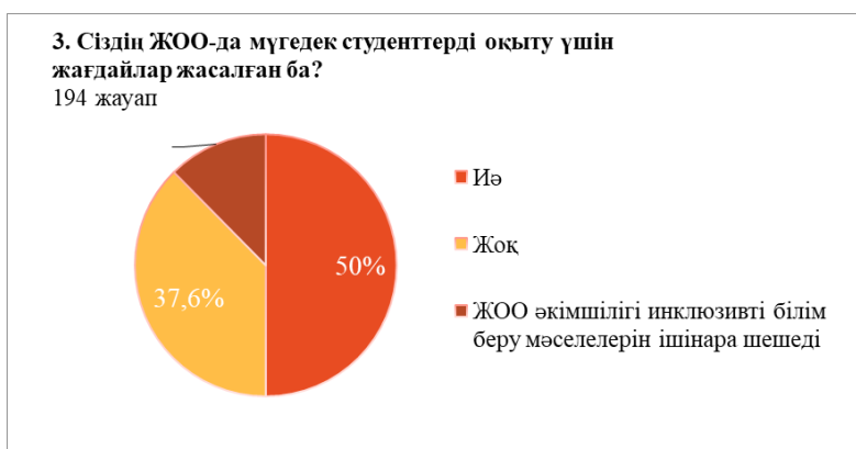
3-сурет – Сауалнаманың үшінші сұрағының нәтижелері

«Сіздің ЖОО-да ерекше білім беру қажеттіліктері бар студенттер үшін оқытуды оқу-әдістемелік сүйемелдеу (силлабустар, оқу құралдары, оқулықтар, әдістемелік нұсқаулар) бар ма?» деген сұраққа респонденттердің 78,9%-ы «иә», 21,1%-ы «жоқ» деп жауап берді. Бұл деректер университеттердің 21,1% оқу материалдарына түзетулер енгізбейді және оларды ерекшеліктері бар студенттерге бейімдемейді деген қорытынды жасауға мүмкіндік береді.