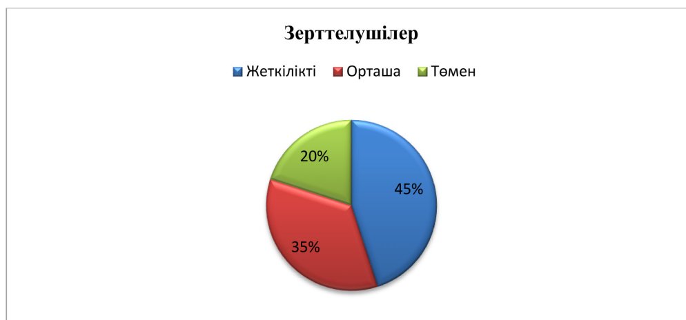
2-сурет. Тіл табысқыштық деңгейін бағалау (В.Ф. Ряховский тесті б/ша) бойынша зерттелушілердің нәтижесі.

жену өз қолыңызда. Қызығушылығыңыз оянған сәтте сіз қарым-қатынасқа барынша тартыласыз. Зерттеушілердің 45%-ының коммуникативтілік қабілеті жеткілікті. Басқа адамдармен қарым-қатынас барысында қызығушылық таныта біледі, шыдамды, өз көзқарасын сақтап қалады. Жаңа адамдармен танысып, қарым-қатынасқа түсуден қорықпайсыз. Дегенмен, шулы ортаны, тым көп сөйлейтін адамдарды ұнатпайды. Тіл табысқыштық деңгейін бағалау (В.Ф. Ряховский тесті б/ша) бойынша зерттелушілердің нәтижесі (диаграмма, сурет 2).