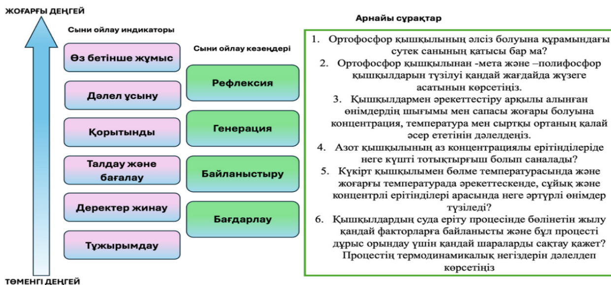
4-сурет – Сыни ойлау кезеңдеріне байланысты оқушыларға қойылған сұрақтардың үлгісі

іздену қабілеттерін дамыту, олардың соңғы аптада зерттеушілік дағдыларын толық меңгеріп, нағыз зерттеуші ретінде жұмыс жасауға дайындауды мақсат етеді. Әр апта сайын мұғалім өтілетін тақырыпқа сай жаңа мәселелік жағдаяттар алып келеді.