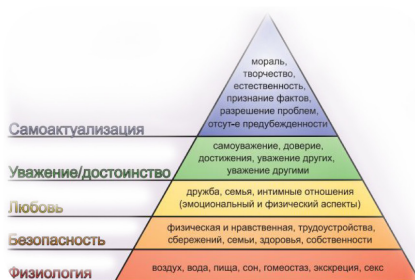
Пирамида потребностей Маслоу

Понимание, каким образом происходит это самое полифонирование, нам дают исследования психологов-гуманистов. Существует множество интерпретаций теории иерархии потребностей, или иерархической модели потребностей человека, представляющей собой некорректно упрощённое изложение идей американского психолога А. Маслоу.