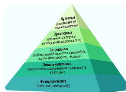
Пирамида потребностей Маслоу