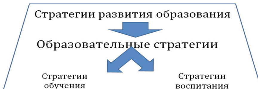
Рисунок 1 – «Пирамида» стратегий в образовании

Тщательное изучение истории образования и образовательной политики Казахстана позволило нам выделить «стратегии развития образования» и «образовательные стратегии» советского периода и нового периода независимости Казахстана.