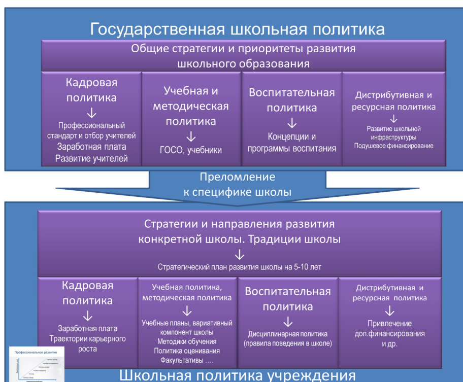
Рисунок 5 – Структура школьной политики и документы РК