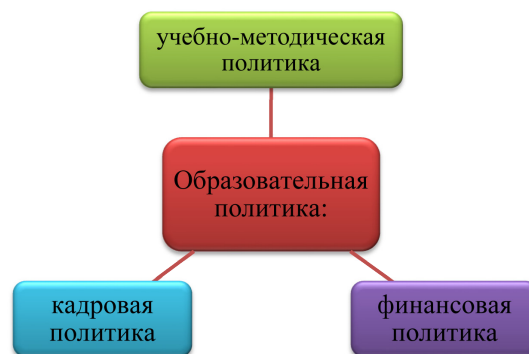
Рисунок 2 – Les Bell и Howard Stevenson выделяют 3 вида политики

Les Bell и Howard Stevenson в работе «Education Policy: Process, Themes and Impact» выделяют учебно-методическую, кадровую, финансовую политики (рисунок 2).