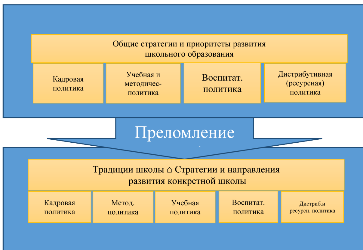
Рисунок 3 – Структура школьной политики

Отдельным компонентом мы выделяем «Общие стратегии и приоритеты развития школьного образования» в «государственной школьной политике». В школьной политике учреждения образования мы выделяем дополнительным компонентом «Традиции школы и стратегии и направления развития конкретной школы» с учетом специфики школы.