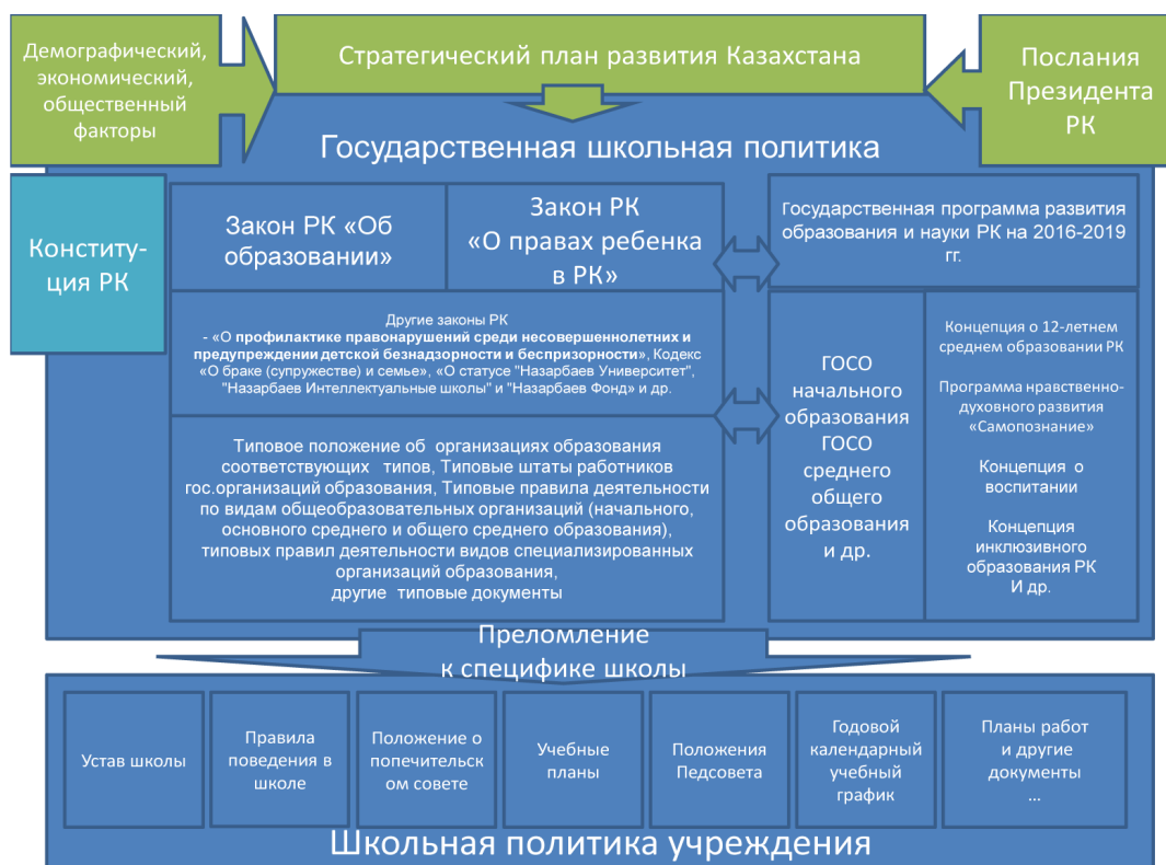
Рисунок 4 – Документы, определяющие школьную политику в Казахстане

Законодательно государственную школьную политику определяют Конституция РК, Закон РК «Об образовании», а также другие законы, регулирующие права детей в республике. Это Законы РК «О правах ребенка в РК» (1989), где закреплено право ребенка на образование; «О профилактике правонарушений среди несовершеннолетних и предупреждении детской безнадзорности и беспризорности», Кодекс «О браке (супружестве) и семье» (регулирует семейные правоотношения), «О статусе Назарбаев Университет», «Назарбаев Интеллектуальные школы» и «Назарбаев Фонд» (для НИШ) и др.