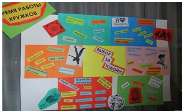
Рисунок 3 – Формы организации кружков педагогами-аниматорами

В тесном сотрудничестве с социальными педагогами участвуют почтовые службы в оказании помощи социальному населению. Сельские почтальоны, передвигаясь по участку, выступают в качестве мобильного почтового отделения.