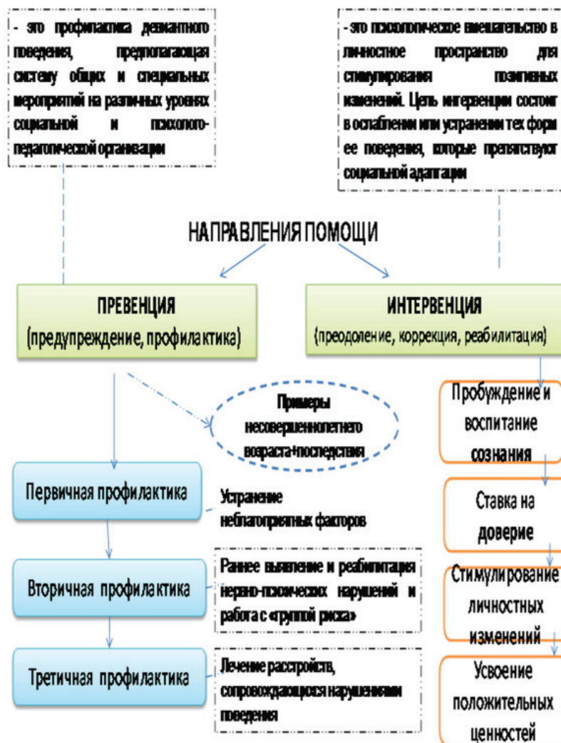
Рисунок 1 – Направления психолого-педагогической работы с детьми девиантного поведения